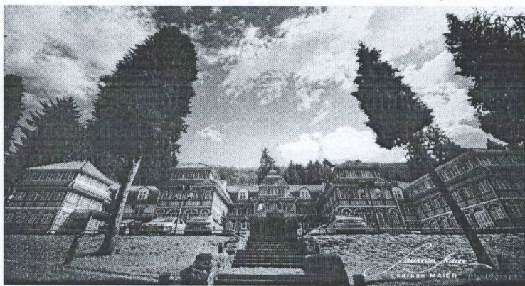
Sighisoara și Târgu Mureș.

Cunoscută și sub denumirea de Vila Magistraților, locația a fost dată în exploatare în mai 2002 și este amplasată pe promenada principală a stațiunii, în două corpuri de vile vechi de 100 ani, renovate și modernizate.